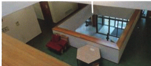
Blick aus der zweiten Ebene zum Haupteingang