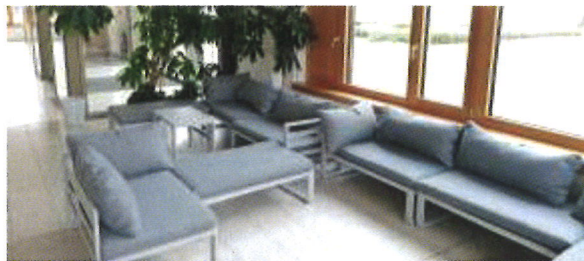
Im Foyer des Oberstufengebäudes